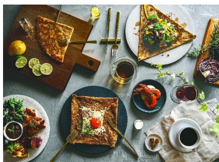
特別ディナー（イメージ）