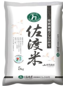
※2017 年 10 月からの新パッケージ