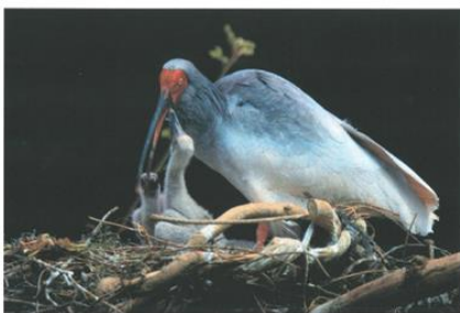
(トキの親子)

該当商品の販売合計 74,524kg × 3円 = 223,572円 + 消費税 17,886円 → 27年産合計金額241,458円